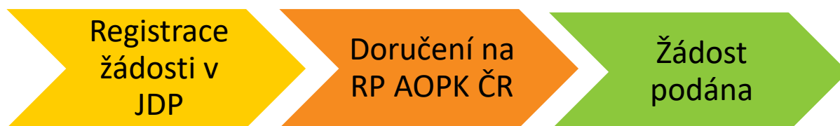
Obr. 1 – Kroky vedoucí k podání žádosti

Žadatel po registraci žádosti vygeneruje její tiskovou verzi ve formátu pdf a podepíše, čímž stvrdí čestná prohlášení a všechny skutečnosti uvedené v žádosti o dotaci. Ve lhůtě maximálně 5 pracovních dnů od registrace žádosti v JDP podepsanou tiskovou verzi žádosti (včetně všech příloh požadovaných dle kap. B.3 a příloh č. 3 a 4 této Příručky, které žadatel neuložil do JDP) doručí na AOPK ČR. Pokud je vytištěná žádost doručena osobně anebo poštou, bude žadatelem podepsána fyzicky. Žádost lze doručit i datovou schránkou (dále jen „DS“). V případě doručení žádosti e-mailem bude žádost podepsána kvalifikovaným elektronickým podpisem. Žádost je považována za podanou v momentě doručení na AOPK ČR.